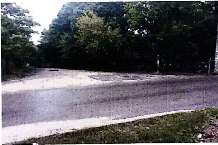
перекрёсток улица Карачевская улица Гурьянова