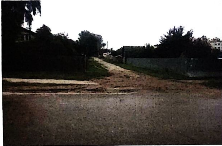
перекрёсток улица Карачевская и переулок Олимпийский